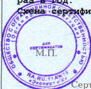
Схема сертификации Зс.

ДОПОЛНИТЕЛЬНАЯ ИНФОРМАЦИЯ Инспекционный контроль проводится один раз в год.